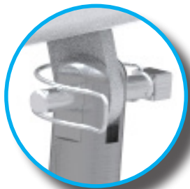
Montaje / desmontaje sin herramientas