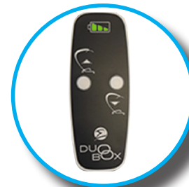
Mando con indicador de estado de carga de batería