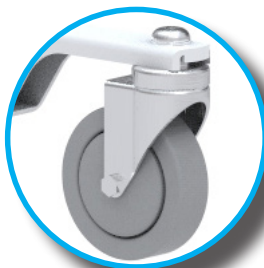
Ruedas con cojinetes