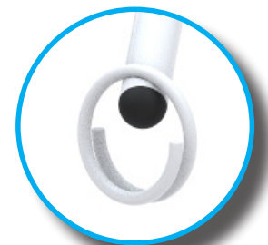
Aro con doble entrada para mayor seguridad